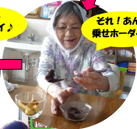
それ! あんこ 乗せホーダイ♪