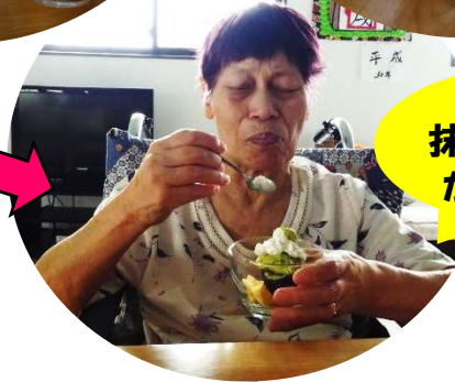
おいしい 抹茶あずきパフェ ができました!

皆さん、童心に帰ったように無邪気に パフェ作りを楽しんでいらっしゃいました。 やはりスイーツの力は偉大です!!!